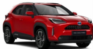
3U5 Érzéki vörös

Metál Elérhető az Active, Comfort és Executive felszereltségeknél 145 000 Ft