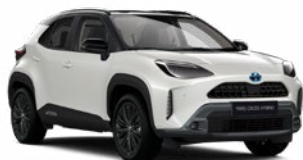
2PU Gyöngyházfehér fekete tetővel

Metál Elérhető az Active, Comfort és Executive felszereltségeknél 145 000 Ft