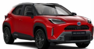
2SZ Érzéki vörös fekete tetővel

Gyöngyház Elérhető az Executive, Adventure, GR SPORT és Premiere Edition felszereltségeknél Felár nélkül