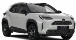
2RZ Higanyszürke fekete tetővel

Metál Elérhető az Executive, Adventure és Premiere Edition felszereltségeknél Felár nélkül