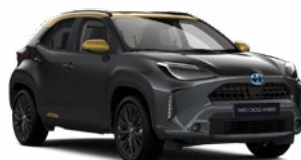
2UA Hamuszürke aranymetál tetővel

Metál Elérhető az GR SPORT felszereltségeknél Felár nélkül