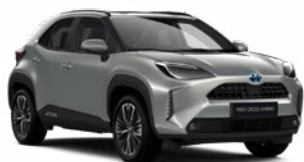
1L0 Palladium ezüst

Metál Elérhető az Active, Comfort és Executive felszereltségeknél 145 000 Ft