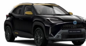
2UB Éjfekete aranymetál tetővel

Metál Elérhető az Adventure és Premiere Edition felszereltségeknél Felár nélkül