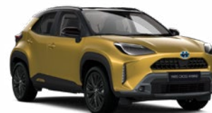
2VS Aranymetál fekete tetővel

Metál Elérhető az Executive, Adventure, GR SPORT és Premiere Edition felszereltségeknél Felár nélkül