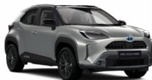
2VU Palladium ezüst fekete tetővel

Egyedi Elérhető az Executive, Adventure, GR SPORT és Premiere Edition felszereltségeknél Felár nélkül