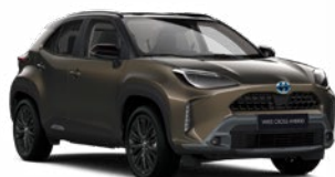
2TK Barnászöld fekete tetővel

Metál Elérhető az Executive, Adventure és Premiere Edition felszereltségeknél Felár nélkül