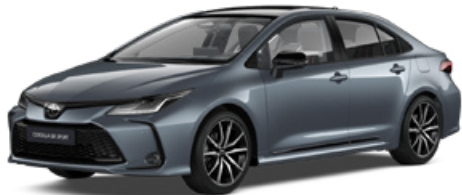
2TH GR-S szürkéskék felár nélkül – GR SPORT