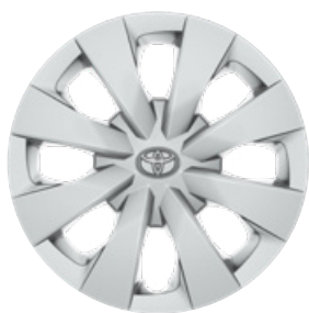
15" acél keréktárcsák díztárcsával (8 küllős) Alapfelszereltség az Active, Hybrid Active felszereltségnél