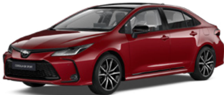
2TB GR-S érzéki vörös felár nélkül – GR SPORT