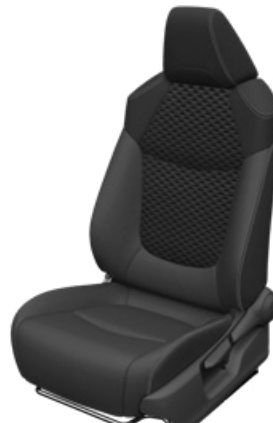
Fekete szövet ülésborítás bőr részekkel és steppelt betétekkel, bézs varrással Alapfelszereltség Hybrid Executive felszereltségnél