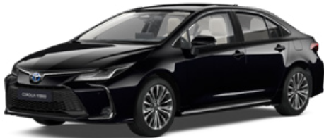
209 Éjfékete* 190 000 Ft