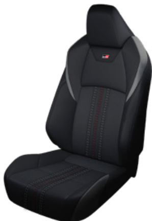
Sötétszürke szövet és szintetikus bőr ülésborítás GR SPORT logoval Alapfelszereltség a GR SPORT és GR SPORT Dynamic felszereltségnél