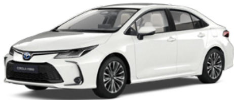
040 Hófehér felár nélkül