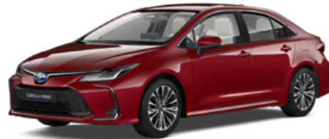
3U5 Érzéki vörös* 290 000 Ft