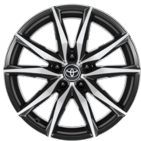
18" csiszolt hatású könnyűfém keréktárcsák (10 küllős) Alapfelszereltség a GR SPORT Dynamic felszereltségnél