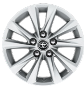
16" könnyűfém keréktárcsák (5 duplaküllős) Alapfelszereltség a Comfort és Hybrid Comfort felszereltségnél