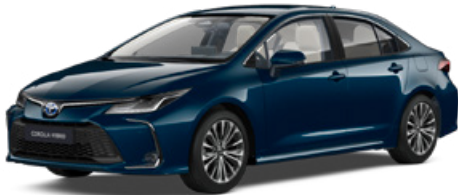
785 Tealevél mély zöld* 290 000 Ft