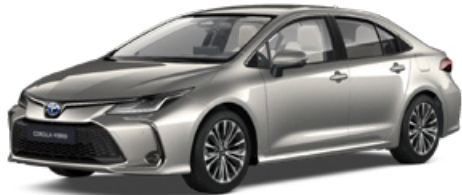
1J6 Krómezüst* 290 000 Ft