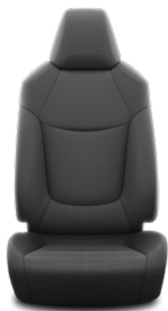
Fekete szövet ülésborítás Alapfelszereltség az Active felszereltségnél