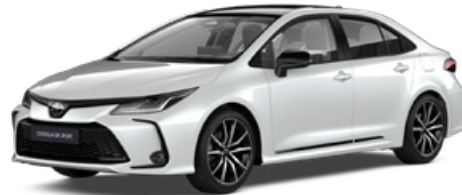
2VP GR-S gyöngyfehér felár nélkül – GR SPORT