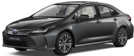
1G3 Szürke metál 190 000 Ft