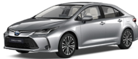
1L0 Palladium ezüst* 190 000 Ft