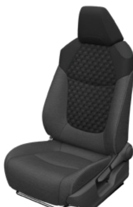
Fekete szövet ülésborítás steppelt fekete betétekkel Alapfelszereltség a Comfort, Comfort Tech és Comfort Style Tech felszereltségnél