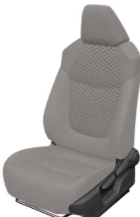
Világosszürke szövet ülésborítás bőr részekkel és steppelt szürke betétekkel, szürke varrással Alapfelszereltség Hybrid Executive felszereltségnél