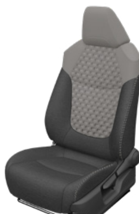
Szürke szövet ülésborítás steppelt világosszürke betétekkel Alapfelszereltség a Comfort, Comfort Tech és Comfort Style Tech felszereltségnél