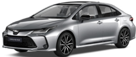
2VU GR-S prémium ezüst felár nélkül – GR SPORT