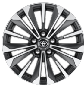
17" kéttónusú fekete, csiszolt hatású könnyűfém keréktárcsák Alapfelszereltség a Comfort Style, Hybrid Comfort Style felszereltségnél