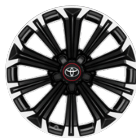
17" GR SPORT könnyűfém keréktárcsák (10 küllős) Alapfelszereltség a GR SPORT felszereltségnél