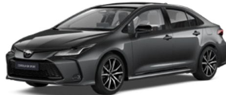
2NB GR-S szürke metál felár nélkül – GR SPORT