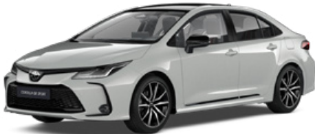
2VF GR-S hamuszürke felár nélkül – GR SPORT