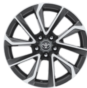
18" kéttónusú, szürke, csiszolt hatású könnyűfém keréktárcsák (5 dupla küllős) Executive Navi szereltségnél széria.