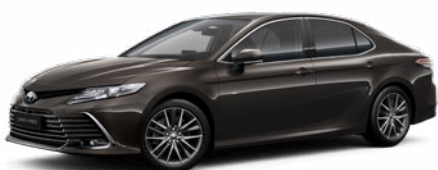
4X7 Grafit szürke* 200 000 Ft