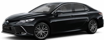
218 Fekete gyöngyház* 200 000 Ft