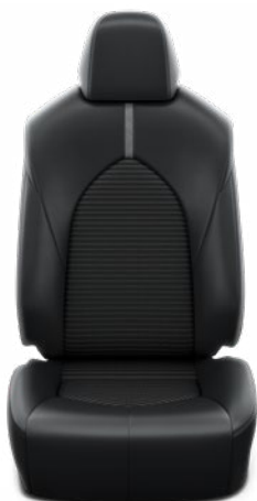
Fekete szintetikus bőr ülésborítás szövet betétekkel Alapfelszereltség a Prestige modellváltozatban