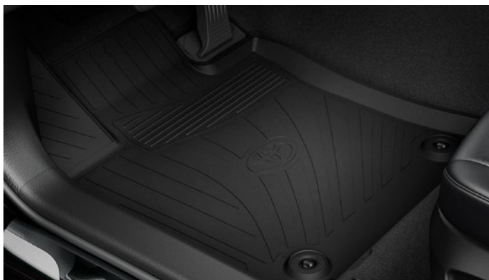
Gumiszőnyeg garnitúra 80 600 Ft