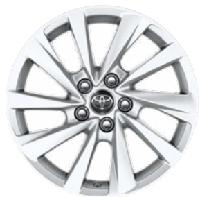
17" könnyűfém keréktárcsák 215/55 R17 gumiabroncsokkal Alapfelszereltség a Comfort modellváltozatnál