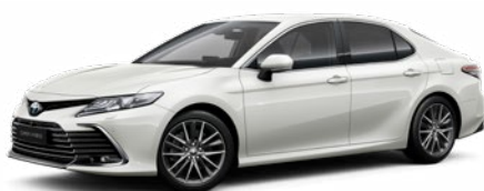
089 Platina gyöngyfehér** 300 000 Ft