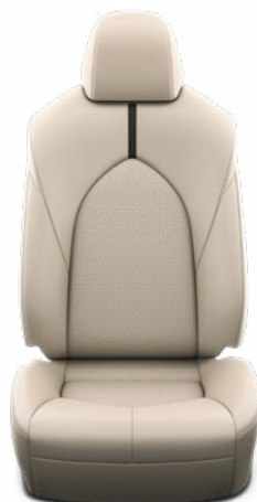
Bézs színű bőr ülésborítás Alapfelszereltség az Executive modellváltozatnál