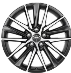
18" csiszolt hatású könnyűfém keréktárcsák 235/45 R18 méretű gumiabroncsokkal Alapfelszereltség a Prestige és az Executive modellváltozatoknál