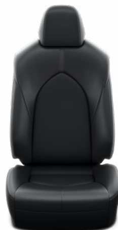
Fekete bőr ülésborítás Alapfelszereltség az Executive modellváltozatnál