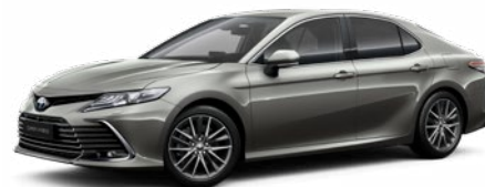
1L5 Sötétszürke* 200 000 Ft