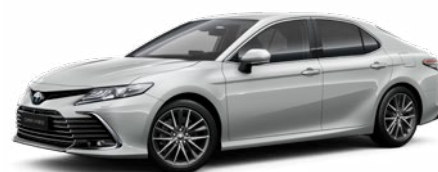
1F7 Ultraezüst* 200 000 Ft