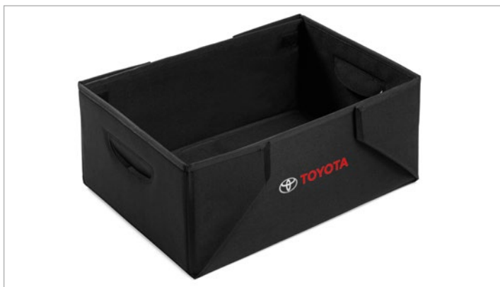
Összecsukható tárolódoboz 39 500 Ft