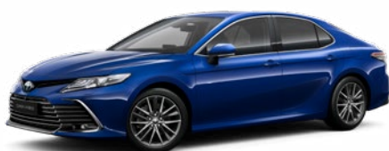
8W7 Kobalt kék* 200 000 Ft