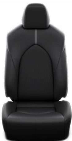
Fekete szövet ülésborítás Alapfelszereltség a Comfort modellváltozatnál