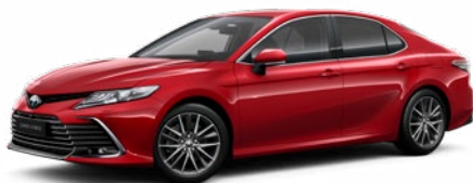
3U9 Érzéki vörös** 300 000 Ft