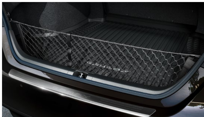
Csomagrögzítő háló 39 100 Ft