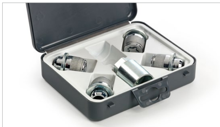
Kerékőr 30 400 Ft