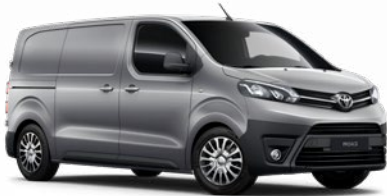
KCA Ezüst Metálfényezés, (nettó ár/bruttó ár): 160 000 Ft/203 200 Ft