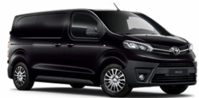
KTV Éjfekete Metálfényezés, (nettó ár/bruttó ár): 160 000 Ft/203 200 Ft