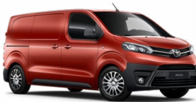
KKX Narancspiros Metálfényezés, (nettó ár/bruttó ár): 160 000 Ft/203 200 Ft