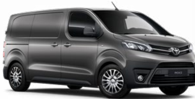
EVL Sólýomszürke Metálfényezés, (nettó ár/bruttó ár): 160 000 Ft/203 200 Ft