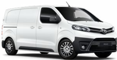
EPR Hófehér Felár nélkül