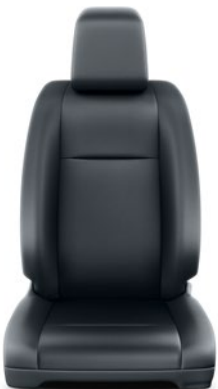
Szürke ülésborítás PVC kombinációval