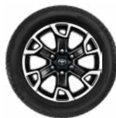
Komplett téli szerelt kerék szett (4 db) 18"-os téli szerelt kerék alufelnivel és Continental Winter Contact TS850 gumibronccsal Nettó ügyfél ár: 781 300 Ft

Ha új autójához téli szerelt kereket vásárol, akkor 3 évig tartó (a nyári gumibroncsra is vonatkozó) gumibiztosítást adunk ajándékba! Az árakkal és a további részletekkel kapcsolatban érdeklődjön márkakereskedőjénél!