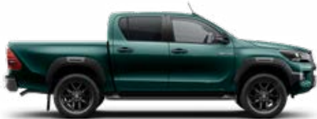
6S3 Oáziszöld Metálfényezés Felár nélkül