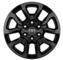
18" fekete könnyűfém keréktárcsa (5 küllős) Alapfelszereltség az Invincible modellváltozaton