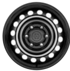
17" fekete acél keréktárcsa Alapfelszereltség a Live extra- és duplakabinos modellváltozaton