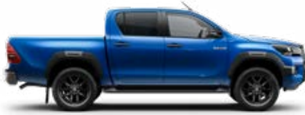
8X2 Vízkék Metálfényezés nettó 255 000 Ft bruttó 323 850 Ft