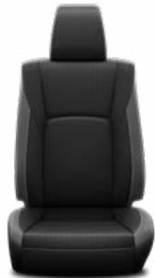
Kéttónusú perforált bőr Alapfelszereltség az Invincible modellváltozaton