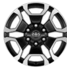
18" fekete, csiszolt felületű könnyűfém keréktárcsa (6 küllős) Alapfelszereltség az Executive modellváltozaton