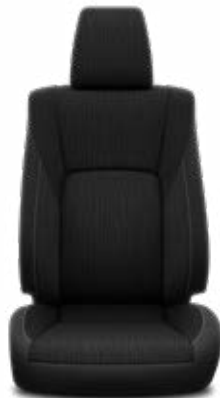
Függőleges mintázatú fekete szövet Alapfelszereltség az Active és Executive modellváltozaton