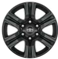
17" sötétszürke könnyűfém keréktárcsa (6 küllős) Alapfelszereltség az Active modellváltozaton