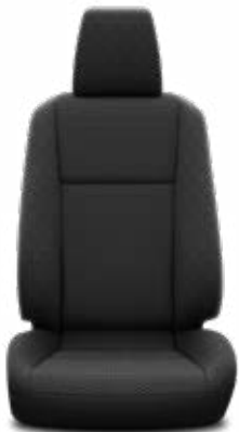
Ovális mintázatú fekete szövet Alapfelszereltség a Live modellváltozaton