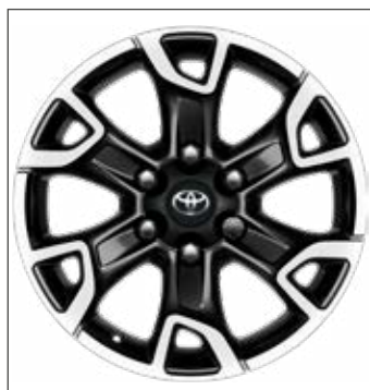
18" fekete, csiszolt hatású könnyűfém keréktárcsák 424 400 Ft