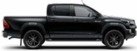
218 Fekete gyöngyház Metálfényezés nettó 255 000 Ft bruttó 323 850 Ft