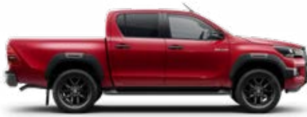
3T6 Lávavörös Metálfényezés nettó 255 000 Ft bruttó 323 850 Ft