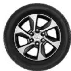
Komplett téli szerelt kerék szett (4 db) 17"-os téli szerelt kerék alufelnivel és Bridgestone LM005 gumibronccsal Nettó ügyfél ár: 791 900 Ft