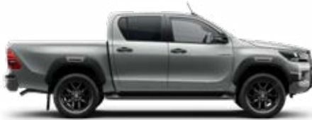
1D6 Ezüstmetál Metálfényezés nettó 255 000 Ft bruttó 323 850 Ft