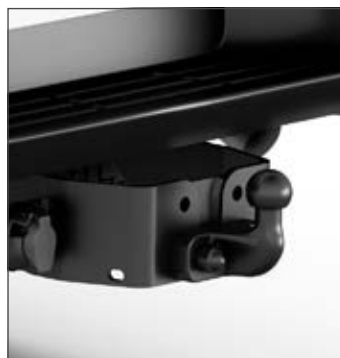
Peremre rögzített vonóhorog Vonóhorog szett 7 pólusú kábellel 268 000 Ft (márkakereskedői szerelés)