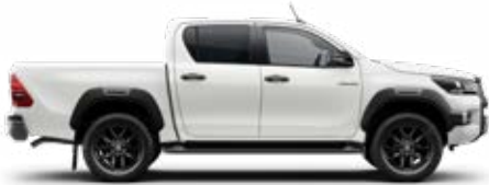
040 Hófehér Alapfényezés felár nélkül