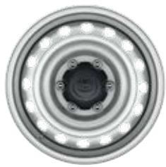
17" ezüst színű acél keréktárcsa Alapfelszereltség a Live szimplakabinos modellváltozaton