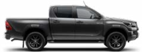
1G3 Hamuszürke Metálfényezés nettó 255 000 Ft bruttó 323 850 Ft