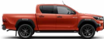
3E5 Chilipiros Metálfényezés Felár nélkül

* Szimplakabinos változatok esetén nem érhető el.