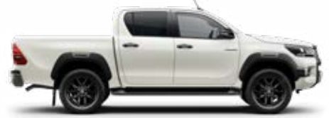
089 Gyöngyfehér* Metálfényezés nettó 310 000 Ft bruttó 393 700 Ft