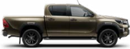
6X1 Barnászöld Metálfényezés nettó 255 000 Ft bruttó 323 850 Ft