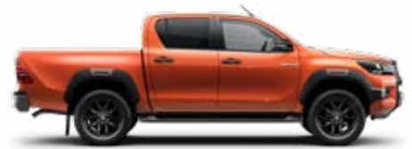
4R8 Narancsmetál Metálfényezés nettó 255 000 Ft bruttó 323 850 Ft