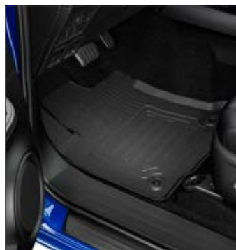
Gumiszőnyeg 33 900 Ft