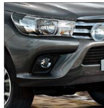
Ködlámpák 315 100 Ft