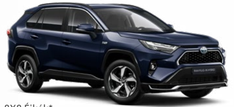
8X8 Éjkék* 190 000 Ft