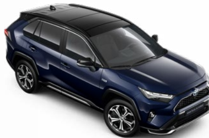
2RA Éjkék fekete tetővel* Selection Sapphire felár nélkül