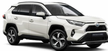
089 Platina gyöngyfehér** 310 000 Ft