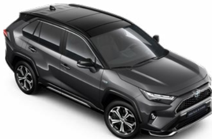
2QZ Hamuszürke fekete tetővel* Selection Graphite felár nélkül