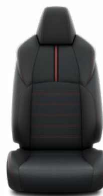
Fekete bőr Alapfelszereltség az Executive modellváltozaton