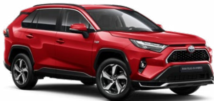
3U5 Érzéki vörös* 190 000 Ft