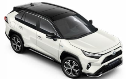
2PS Platina gyöngyfehér fekete tetővel** Selection Pure felár nélkül