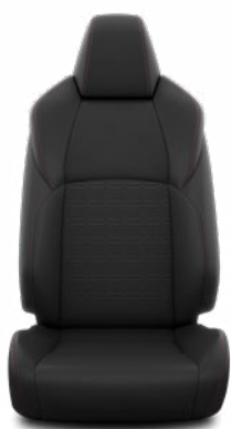
Fekete szövet Alapfelszereltség a Dynamic modellváltozaton