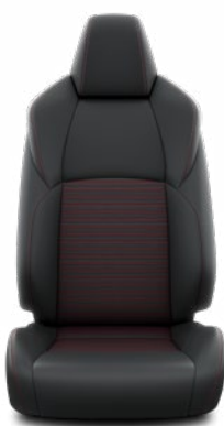
Fekete bőrhatású Alapfelszereltség a Selection modellváltozaton