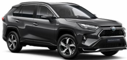
1G3 Hamuszürke* 190 000 Ft