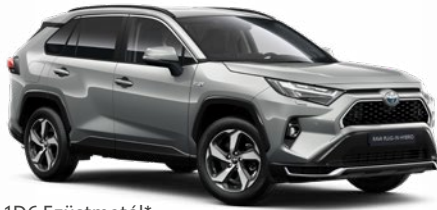
1D6 Ezüstmetál* 190 000 Ft