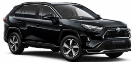
218 Fekete gyöngyház* 190 000 Ft