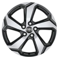
18" szürke, csiszolt felületű könnyűfém keréktárcsa (5 küllős) Alapfelszereltség a Dynamic modellváltozaton