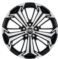
19" fekete, csiszolt felületű könnyűfém keréktárcsa (5 küllős) Alapfelszereltség a Selection és Executive modellváltozaton