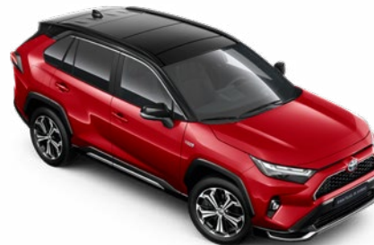
25C Érzéki vörös fekete tetővel Selection felár nélkül