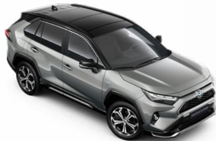
2QY Ezüstmetál fekete tetővel* Selection Platinum felár nélkül