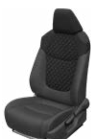
Fekete szövet ülésborítás steppelt fekete betétekkel Alapfelszereltség a Comfort, Comfort Tech és Comfort Style Tech felszereltségnél