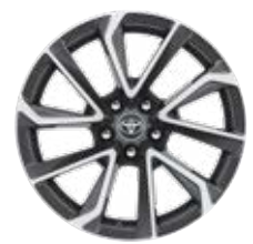
18" könnyűfém keréktárcsák 225/40 R18 gumiabroncsok Alapfelszereltség: Executive