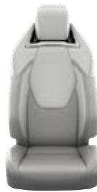
Világosszürke szövet ülésborítás bőr részekkel és steppelt szürke betétekkel, szürke varrással Alapfelszereltség az Executive és Hybrid Executive felszereltségnél