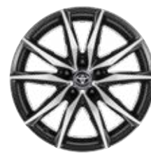
18" könnyűfém keréktárcsák 225/40 R18 gumiabronccsal Alapfelszereltség: GR SPORT + Dynamic