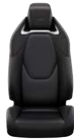
Sötétszürke szövet és szintetikus bőr ülésborítás GR Sport logoval Alapfelszereltség a GR Sport és GR SPORT Dynamic felszereltségnél