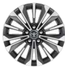
17" könnyűfém keréktárcsák 225/45 R17 gumiabronccsal Alapfelszereltség: Style