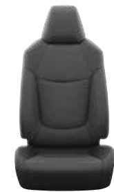
Fekete szövet ülésborítás Alapfelszereltség az Active felszereltségnél