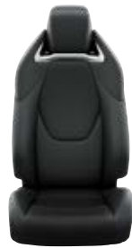
Fekete szövet ülésborítás bőr részekkel és steppelt betétekkel, bézs varrással Alapfelszereltség az Executive és Hybrid Executive felszereltségnél