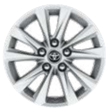
16" könnyűfém keréktárcsák 205/55 R16 gumiabronccsal Alapfelszereltség: Comfort és Comfort + Tech