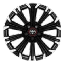
17" könnyűfém keréktárcsák 225/45 R17 gumiabroncsok Alapfelszereltség: GR SPORT