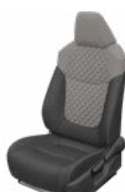
Szürke szövet ülésborítás steppelt világosszürke betétekkel Alapfelszereltség a Comfort, Comfort Tech és Comfort Style Tech felszereltségnél