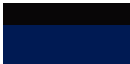
2VL GR SPORT Boróka metál felár nélkül