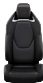
Sötétszürke szövet és szintetikus bőr ülésborítás GR SPORT logoval Alapfelszereltség a GR SPORT és GR SPORT Dynamic felszereltségnél