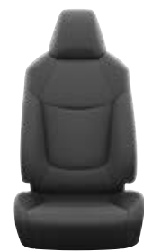
Fekete szövet ülésborítás Alapfelszereltség az Active felszereltségnél