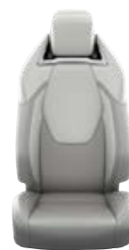
Világosszürke szövet ülésborítás bőr részekkel és steppelt szürke betétekkel, szürke varrással Alapfelszereltség az Executive és Hybrid Executive felszereltségnél