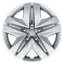
16" acél keréktárcsák 205/55 R16 gumiabroncsok díszláncával Alapfelszereltség: Active