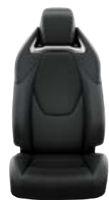
Fekete szövet ülésborítás bőr részekkel és steppelt betétekkel, bézs varrással Alapfelszereltség az Executive és Hybrid Executive felszereltségnél