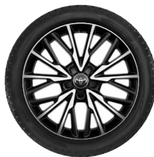
Téli szerelt kerék 18" könnyűfém keréktárcsa, 215/50 R18 92V Continental WinterContact TS870P

Autójához vásárolt téli szerelt kerekek mellé 3 évig tartó (a nyári gumiabroncsra is vonatkozó) gumibiztosítást adunk ajándékba! Az árakkal és a további részletekkel kapcsolatban érdeklődjön márkakereskedőjénél!