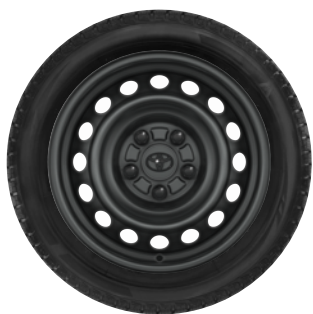
Téli szerelt kerék 16" acél keréktárcsa, 205/65 R16 95H Semperit