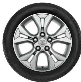
Téli szerelt kerék 16" alu keréktárcsa, 205/65 R16 95H Bridgestone LM005