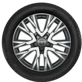
Téli szerelt kerék 17" alu keréktárcsa, 215/55 R17 98V Bridgestone LM005