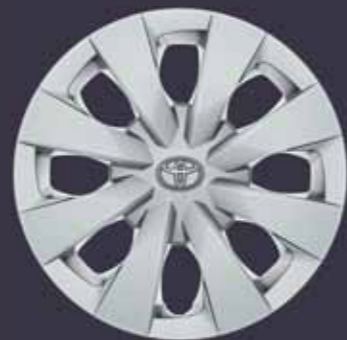
15" acél keréktárcsák dísz tárcsával (6 dupla küllős) Alapfelszereltség: Active