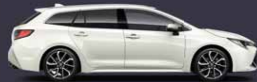
089 Platina gyöngy* §