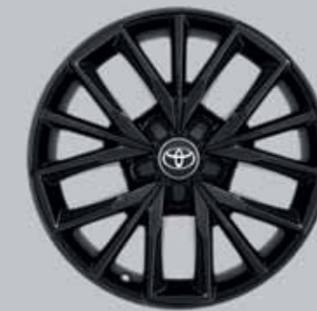
17" fekete könnyűfém keréktárcsák (5 tripla küllős)