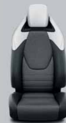
Fekete/szürke szövet, bőr betétekkel & fekete díszcsíkkal Alapfelszereltség: Executive