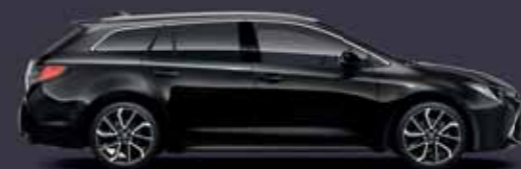
209 Éjfékete §