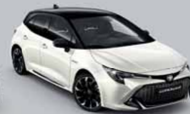
2NR Hófehér/Éjfékete §