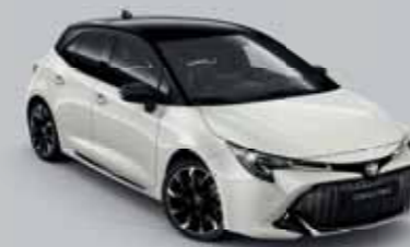
2PU Platina gyöngy*/Éjfékete §