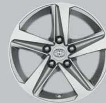
16" ezüst színű könnyűfém keréktárcsák