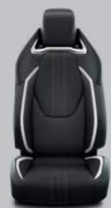
Sötétszürke szövet, fekete bőrhatású betétekkel, fényes króm díszcsíkkal Alapfelszereltség: GR-Sport