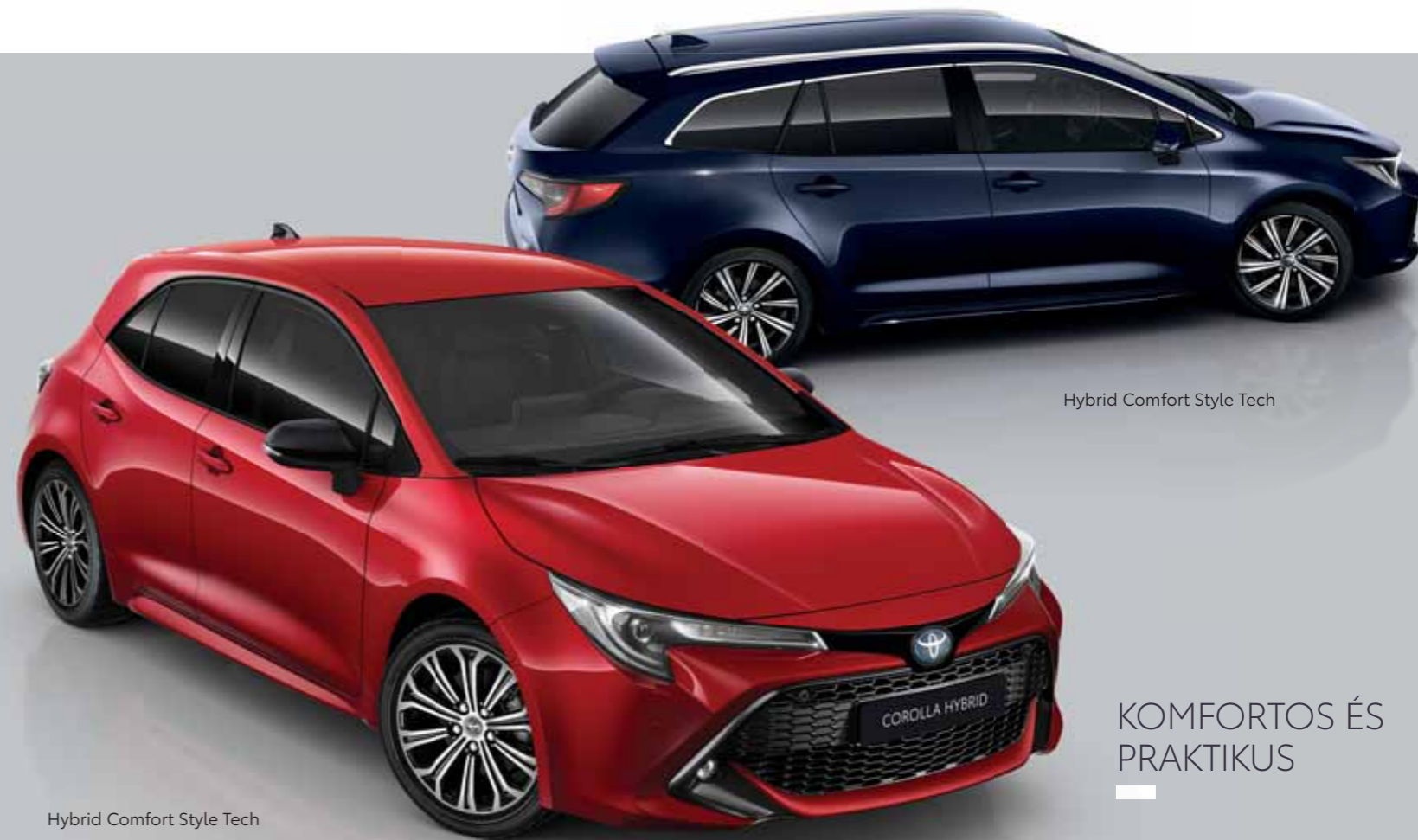
Hybrid Comfort Style Tech