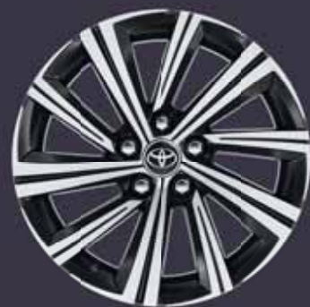
17" csiszolt hatású könnyűfém keréktárcsák (10 küllős) Alapfelszereltség: Style Tech