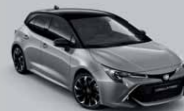
2QS Manhattan szürke § /Éjfékete §