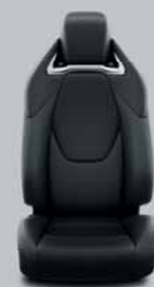
Fekete, perforált bőr & fényes króm díszcsíkkal Alapfelszereltség: Executive VIP