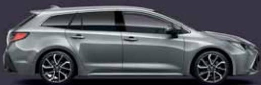
1H5 Manhattan szürke §