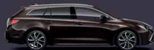
4W9 Kávébarna §