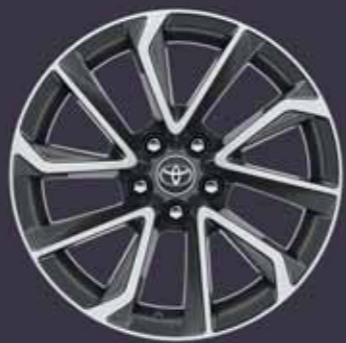
18" kéttónusú, szürke csiszolt hatású könnyűfém keréktárcsák (5 dupla küllős) Alapfelszereltség: Executive VIP