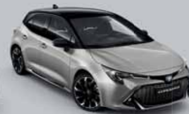
2RD Krómezüst § /Éjfékete §