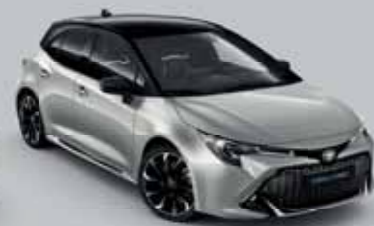
2TX Prémium ezüst § /Éjfékete §