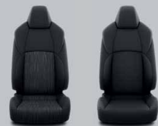
Fekete szövet Alapfelszereltség: Active Fekete, steppelt szövet, szürke varrással Alapfelszereltség: Comfort