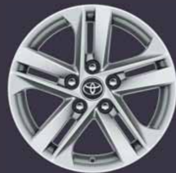
16" könnyűfém keréktárcsák (5 dupla küllős) Alapfelszereltség: Comfort