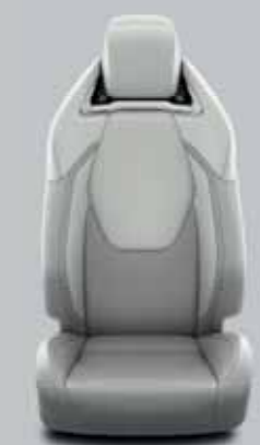
Szürke, perforált bőr & fényes króm díszcsíkkal Alapfelszereltség: Executive VIP