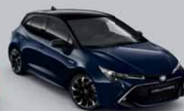
2UQ Sötétkék § /Éjfékete §