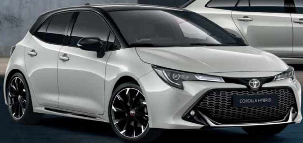
GR Sport Dynamic