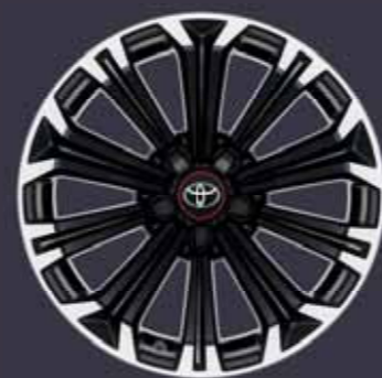
17" csiszolt hatású könnyűfém keréktárcsák (10 küllős) Alapfelszereltség: GR Sport