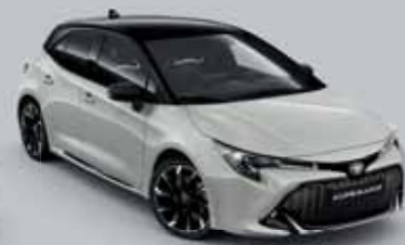
2RZ Higanyszürke § /Éjfékete §