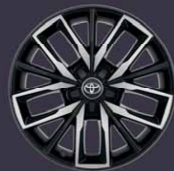
17" fekete csiszolt hatású könnyűfém keréktárcsák Alapfelszereltség: TREK