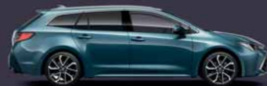
8U6 Acélkék §