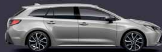
1J6 Krómezüst §