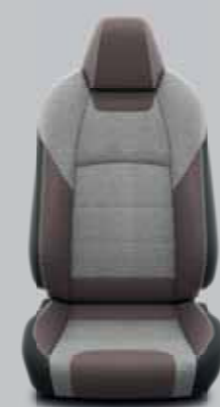
Barna szövet szürke betétekkel szürke varrással Alapfelszereltség: TREK