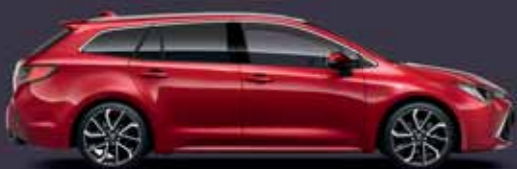
3U5 Érzéki vörös §