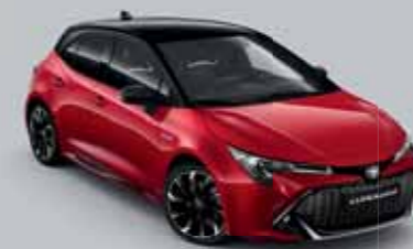
2SZ Érzéki vörös § /Éjfékete §