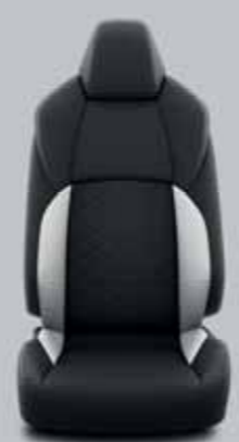
Fekete/szürke steppelt szövet, szürke varrással Alapfelszereltség: Comfort