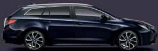
8X8 Sötétkék §