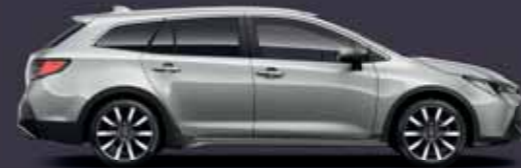
1L0 Prémium ezüst §