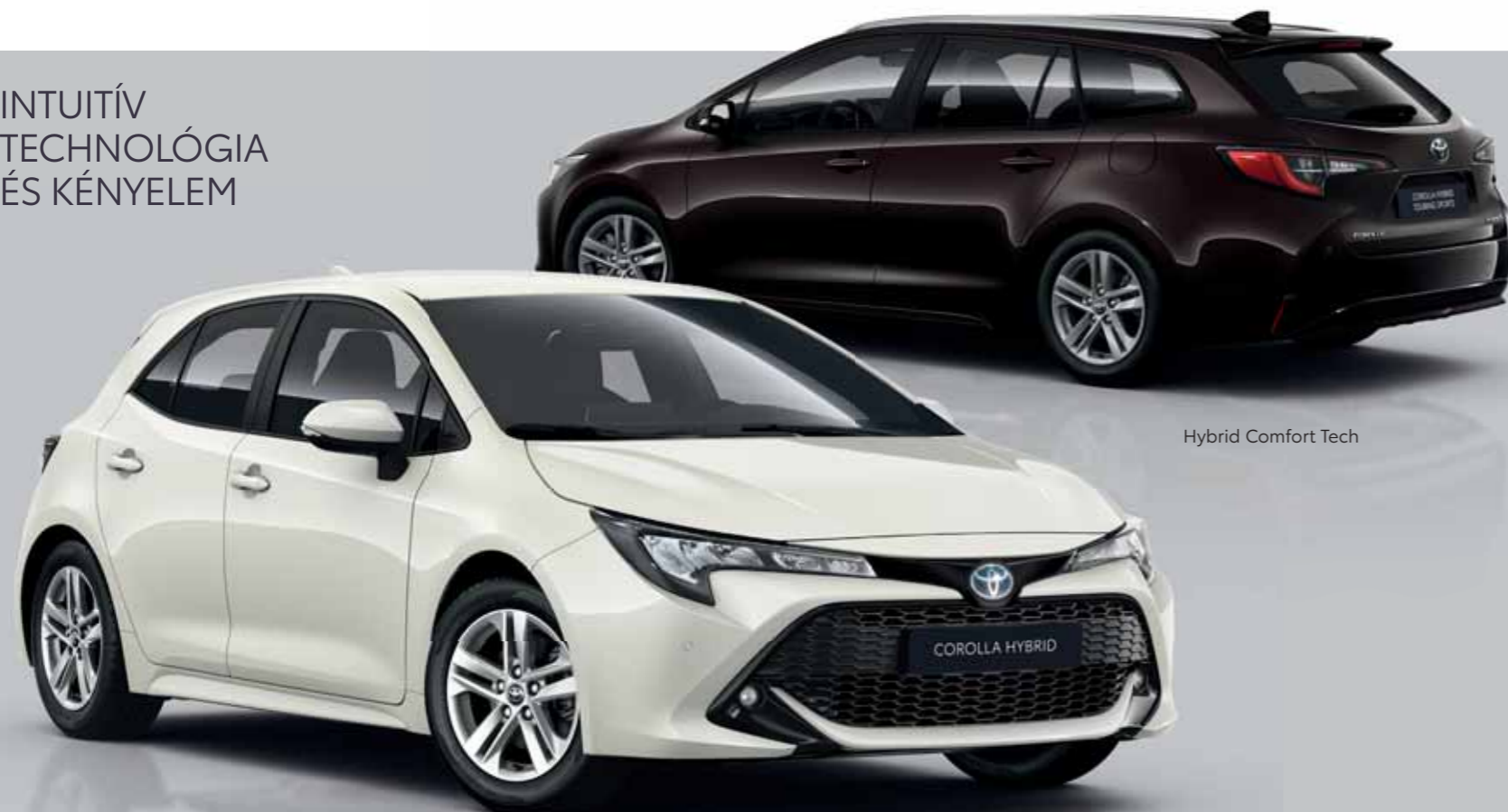
Hybrid Comfort Tech