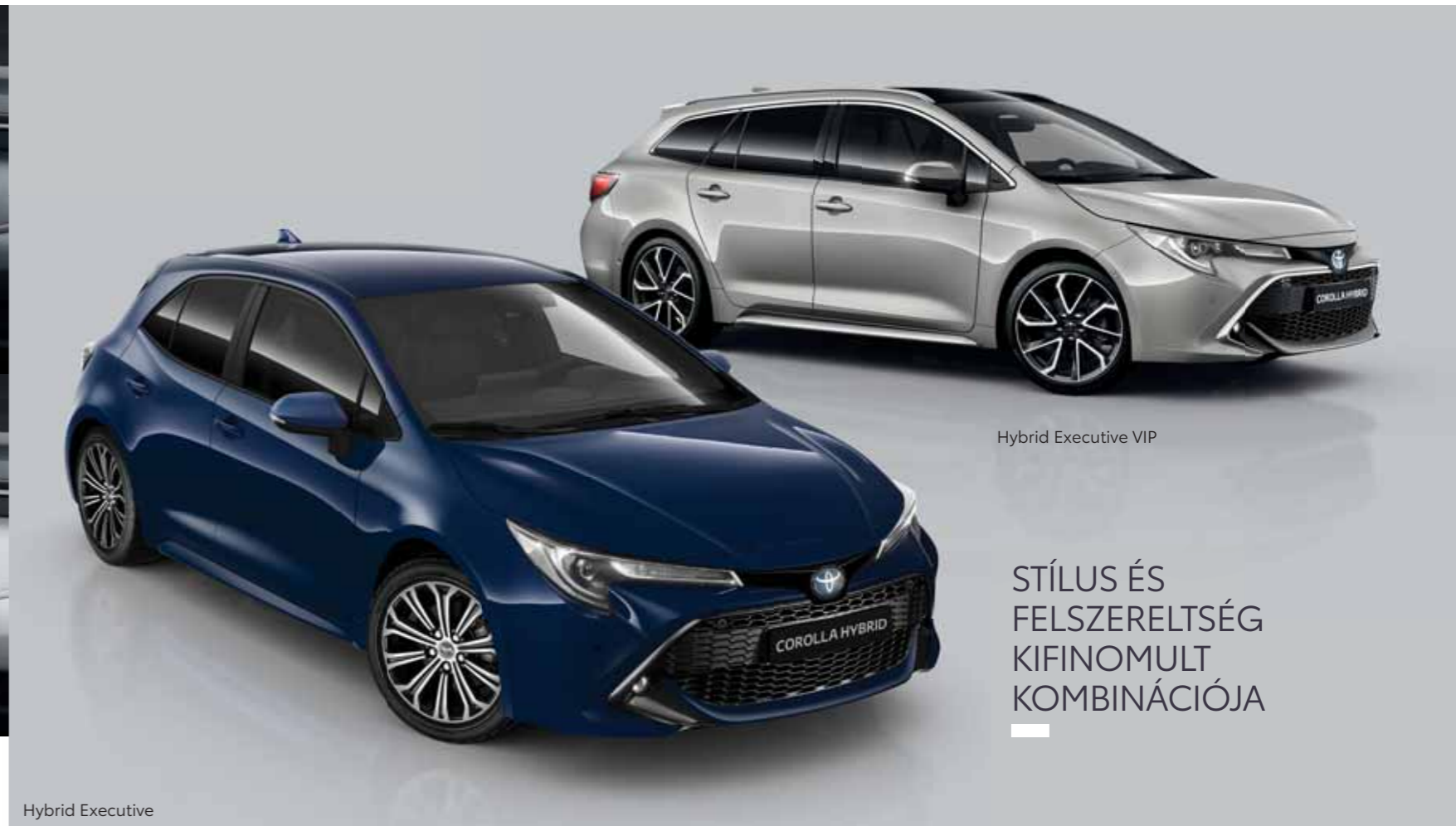
Hybrid Executive VIP

STÍLUS ÉS FELSZERELTSÉG KIFINOMULT KOMBINÁCIÓJA