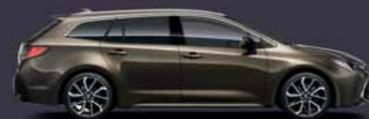
6X1 Barnászöld §