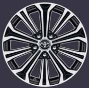
17" fekete csiszolt hatású könnyűfém keréktárcsák (10 küllős) Alapfelszereltség: Executive