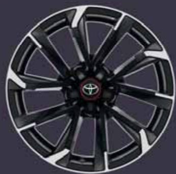
18" kéttónusú fekete csiszolt hatású könnyűfém keréktárcsák (5 duplaküllős) Alapfelszereltség: GR Sport Dynamic