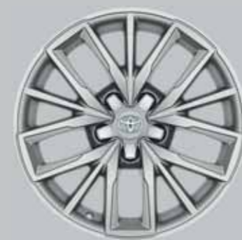
17" ezüst színű könnyűfém keréktárcsák (5 tripla küllős)