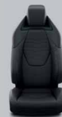
Fekete szövet, bőr betétekkel, piros varrással & fekete díszítéssel Alapfelszereltség: Executive