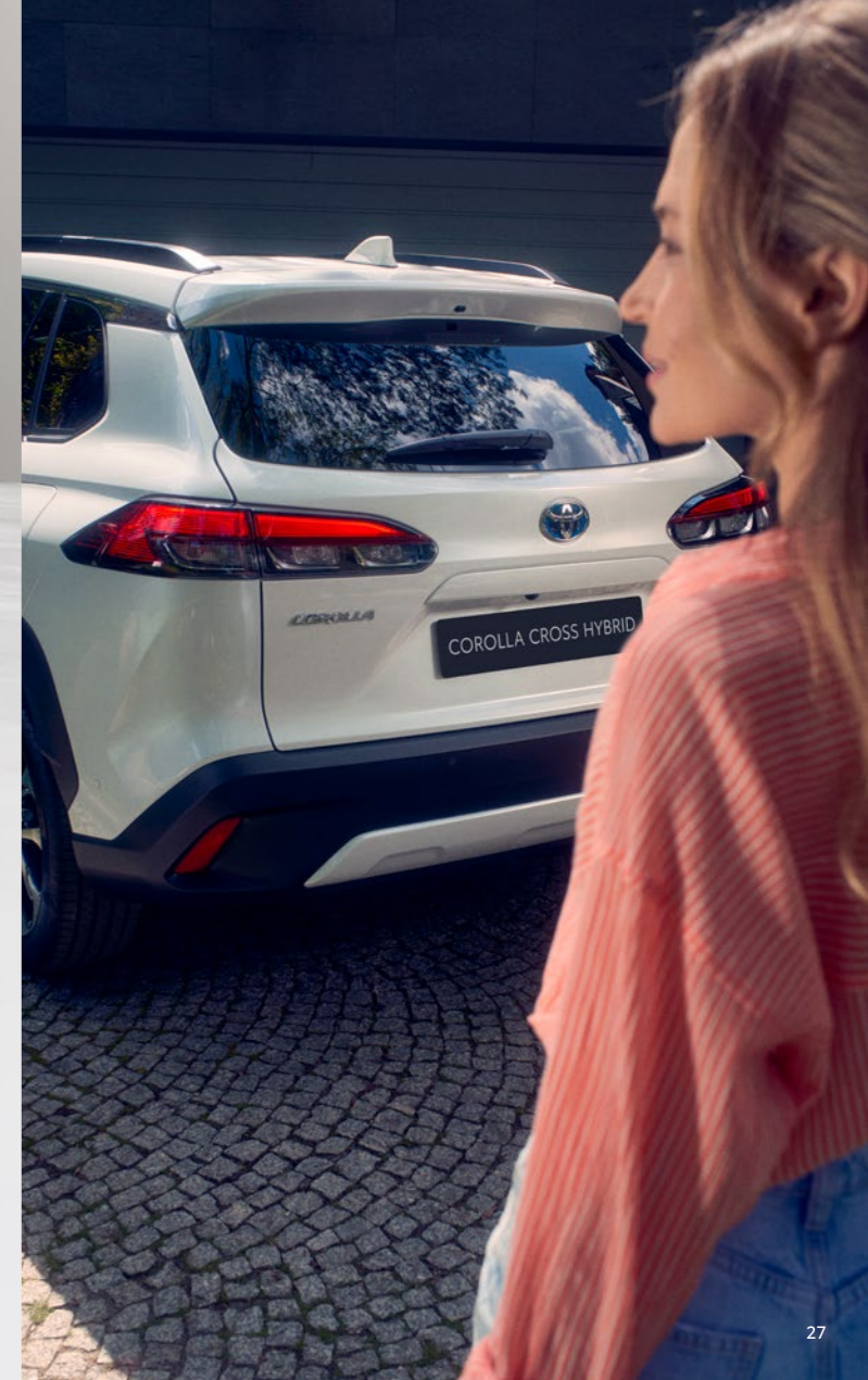
Corolla Cross kéttónusú színválaszték ‡ .