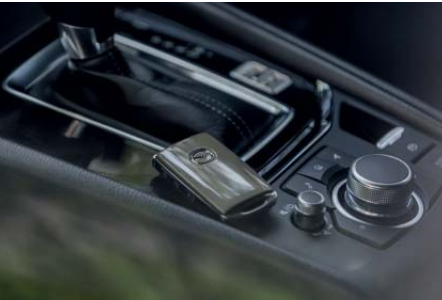
Karosszéria színére fényezett kulcs

A Mazda olyan kiegészítőket tervezett, melyek tökéletesen illeszkednek az Ön autójának megjelenéséhez.