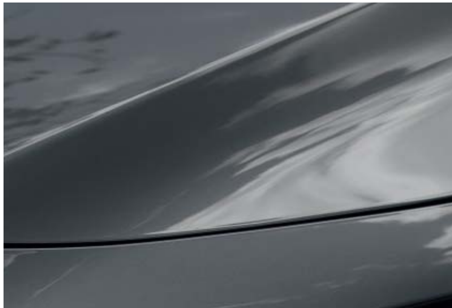
Machine szürke metál

Látogasson el webhelyünkre, ahol megtekintheti a rendelkezésre álló élénk színek választékát.