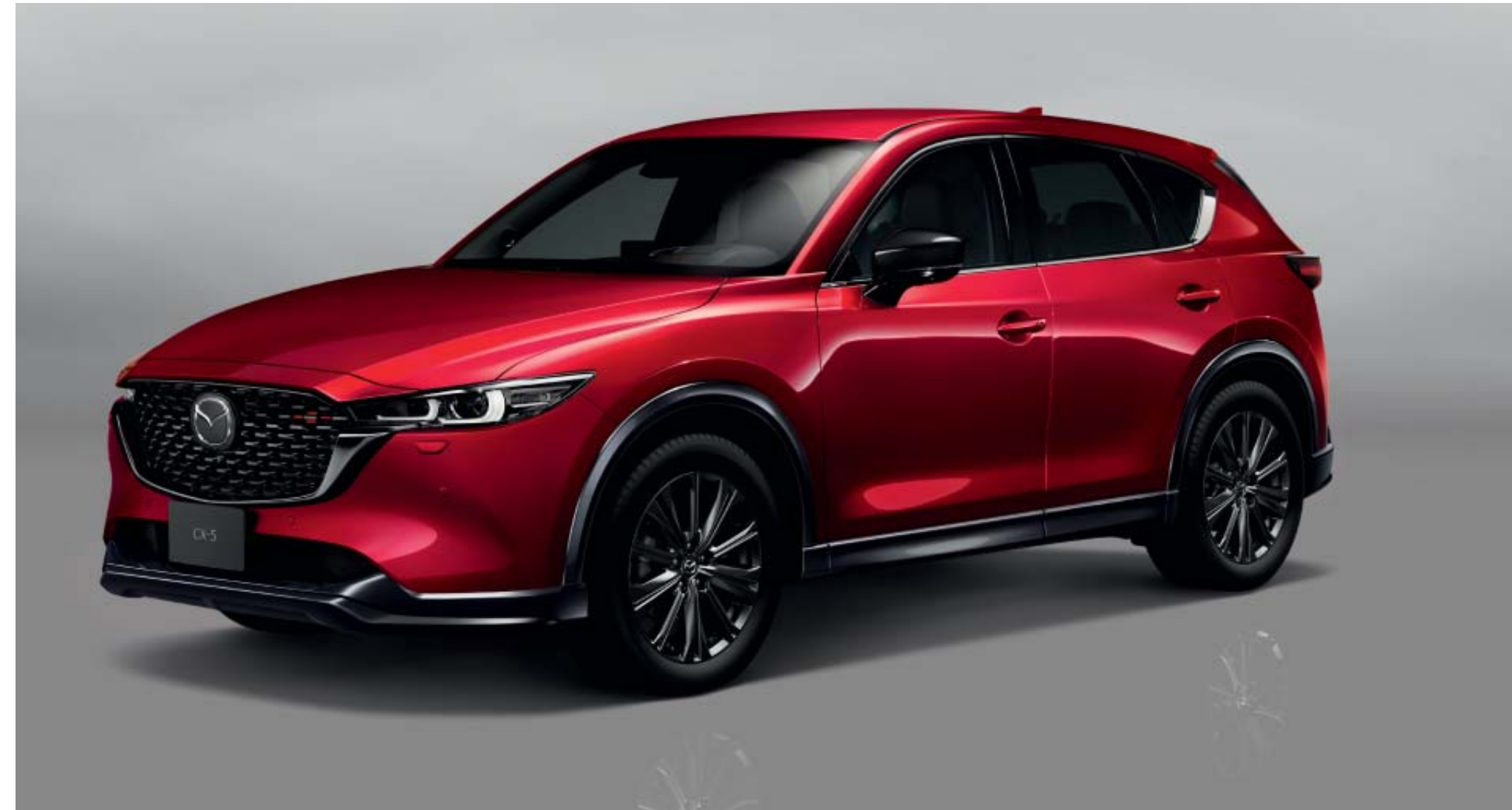
Feketére fényezett kiegészítők

* a kiegészítők várhatóan a 2022-es év második felétől elérhetőek