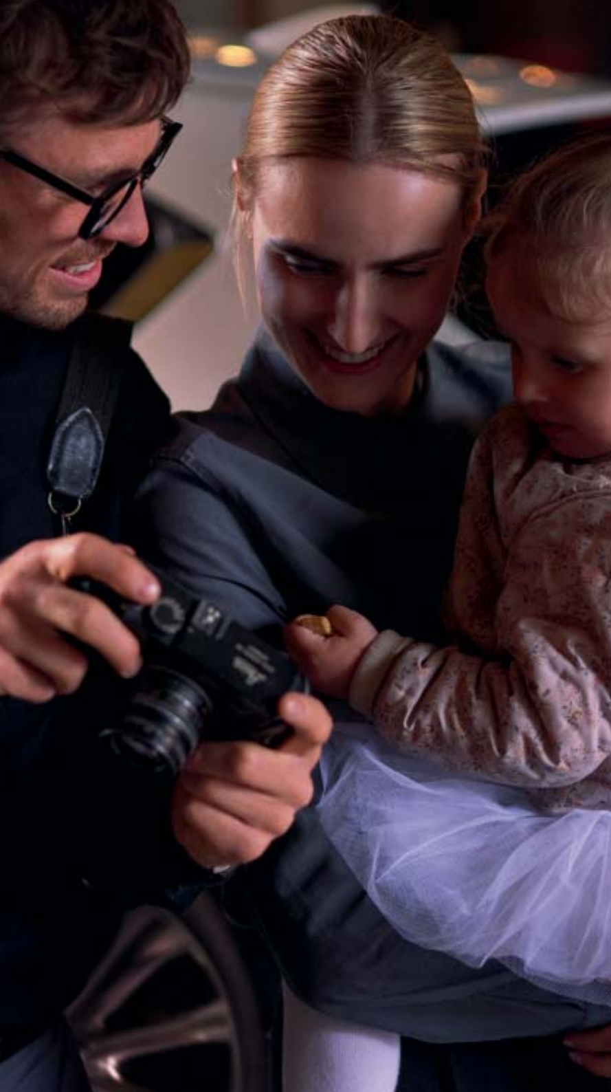
2022 Mazda CX-5