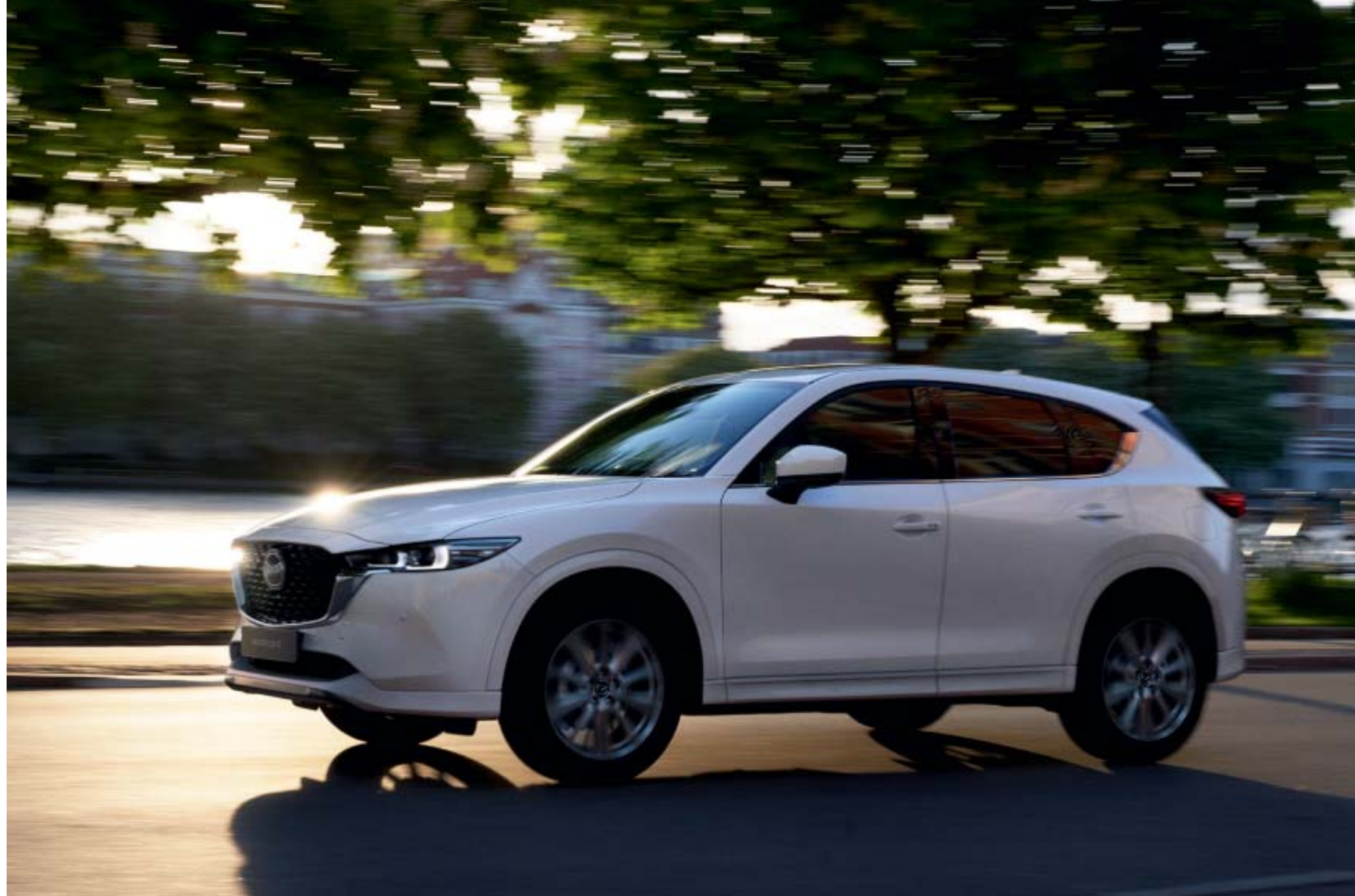
2022-es Mazda CX-5 magas felszereltség Snowflake White Pearl színben