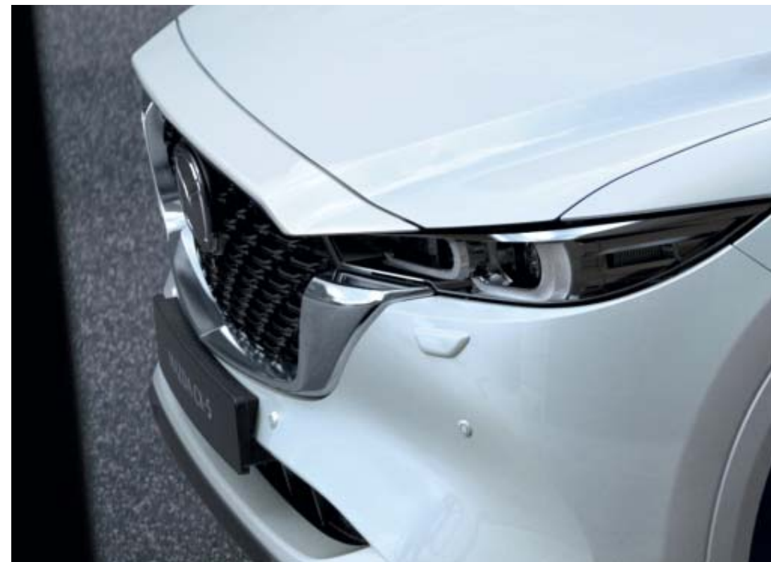
2022-es Mazda CX-5 magas felszereltség Snowflake White Pearl színben