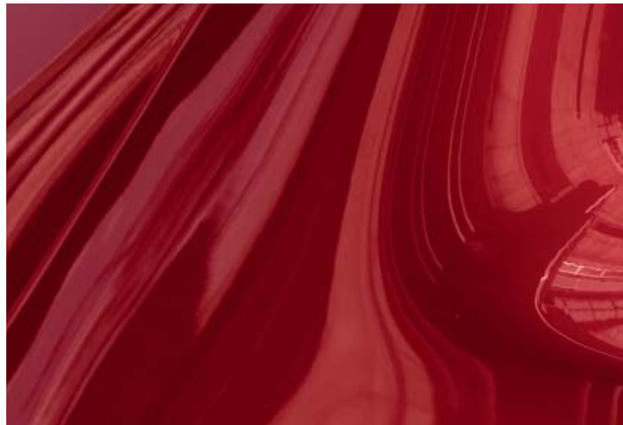
Soul Red Crystal