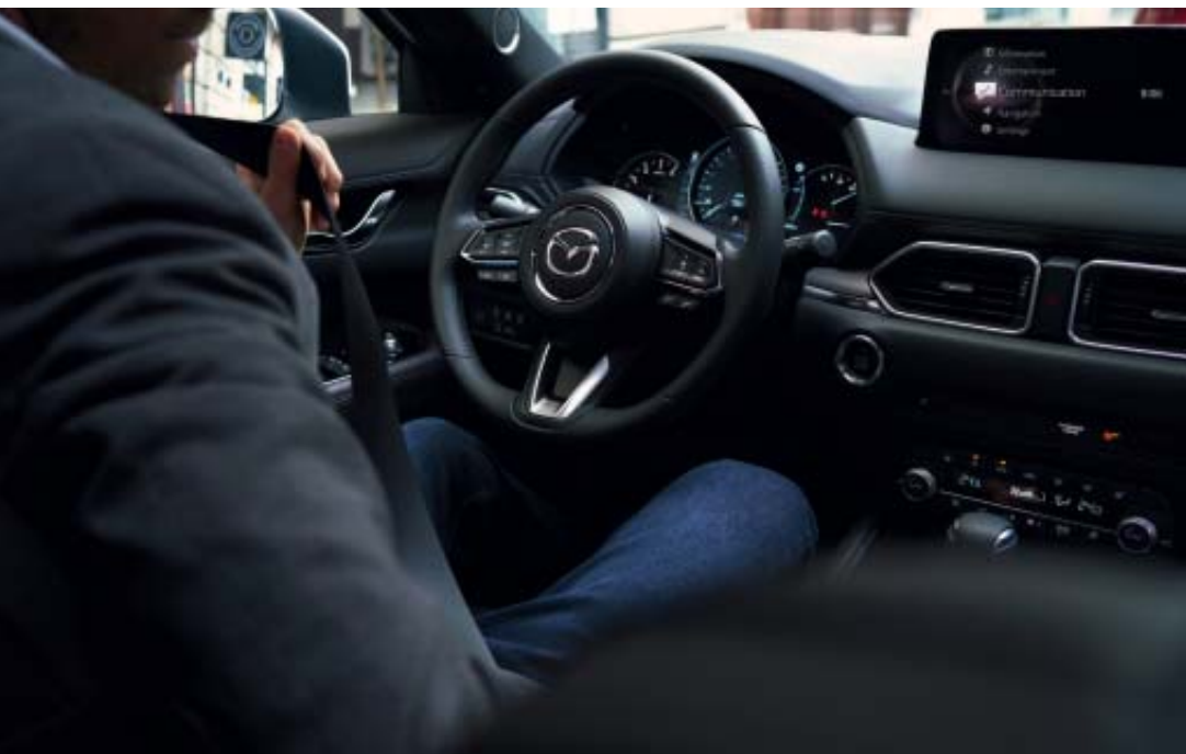
2022-es Mazda CX-5

Ideje megtapasztalni a vezetési élmény új dimenzióját. A legapróbb részletekig a legnagyobb gondossággal megtervezett és kidolgozott, továbbfejlesztett 2022-es Mazda CX-5 – még álló helyzetben is – kiemelkedik a tömegből. A kifinomult teljesítményt a gázpedál érintésekor, a CX-5 művészet formává emeli a mozgást. A Kodo tervezési filozófiánkól ihletet merítve új szintre emeltük a CX-5 elegáns külső stílusát. Az eleje erőteljes, új, háromdimenziós hűtőrács és jellegzetes szárnykialakítása a stílus és az erő harmonikus keveréke. Mind a fényszórók, mind a hátsó lámpák elegánsan át lettek alakítva., Három új felszereltségi szint további finom különbségeket tartalmaz, így megtalálhatja az egyéni stílusához illő tökéletes megjelenést. A 2022-es Mazda CX-5 inspirál, hogy üljön a kormány mögé és vezessen.