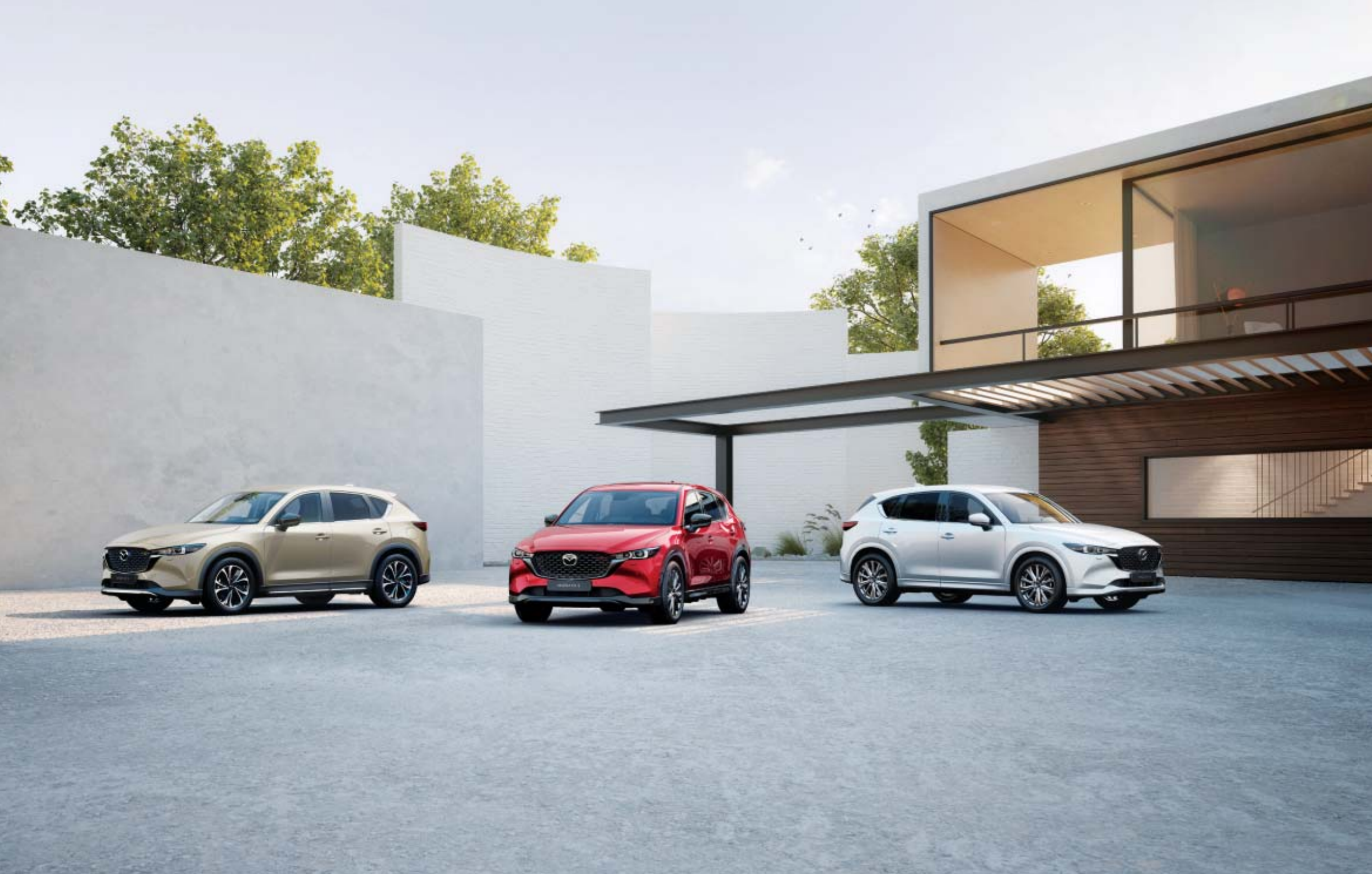
2022-es Mazda CX-5, Newground, Homura Plus, Takumi Plus felszereltségben