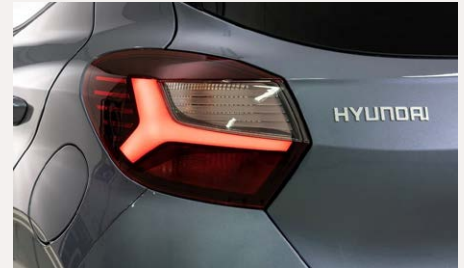
LED-es hátsó lámpák