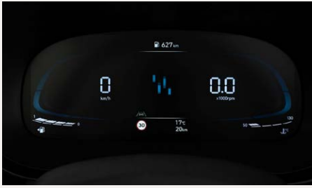
4,2"-os Supervision műszeregység