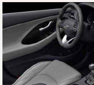
Pewter Gray - csak szövet