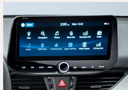
10,25"-os Navigációs rendszer