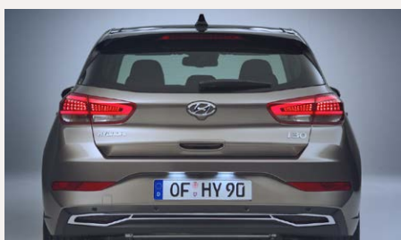
Króm betét a hátsó lökhárítón