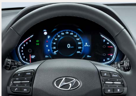
7"-os Supervision műszeregység