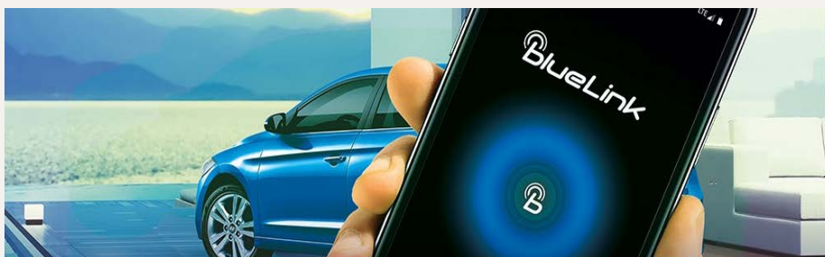
BlueLink telematika, csatlakoztatott gépjármű szolgáltatások - Kattintson a képre!