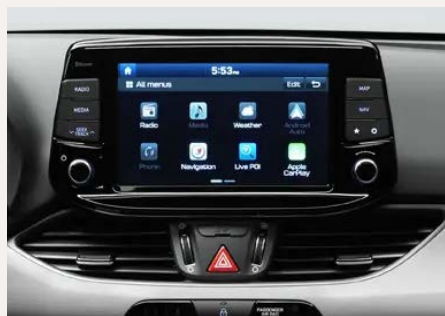
8"-os Display audiorendszer