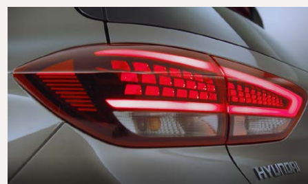
LED-es hátsó lámpatest