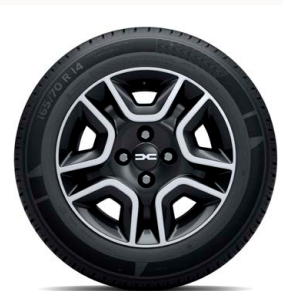
14" acél keréktárcsa DORIA dísz tárcsa (FlexWheel®) - fekete (fehér logo)