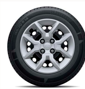
14" acél keréktárcsa BALBOA dísz tárcsa - ezüst