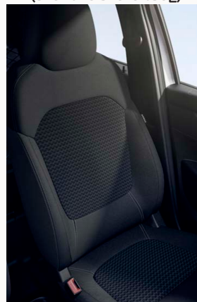
Szürke / szürke mintás textilkárpitozás szürke varrásokkal