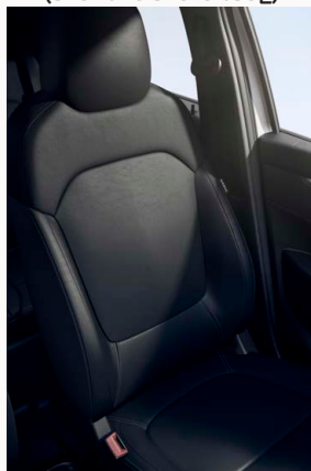
Fekete bőrhatású (TEP) kárpitozás szürke varrásokkal